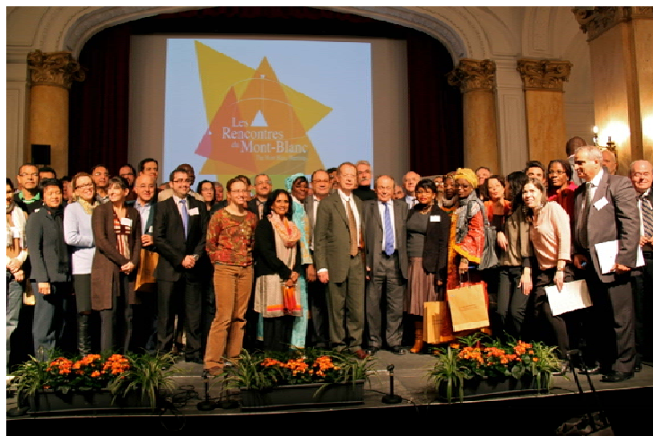
Quelques participants et organisateurs lors des Vèmes Rencontres du Mont-Blanc

dirigeants d'organisations de l'économie sociale de tous les continents (mutuelles, coopératives, fondations, etc.) y participaient. Une délégation québécoise d'une trentaine de personnes y était : GESQ, Caisse d'économie solidaire Desjardins, Fondation, CQCM, SOCODEVI, DID, Desjardins, Équiterre. Sur le terrain de l'environnement, l'économie sociale a certes des atouts, mais jusqu'à maintenant cela n'a pas été son terrain privilégié : les entreprises